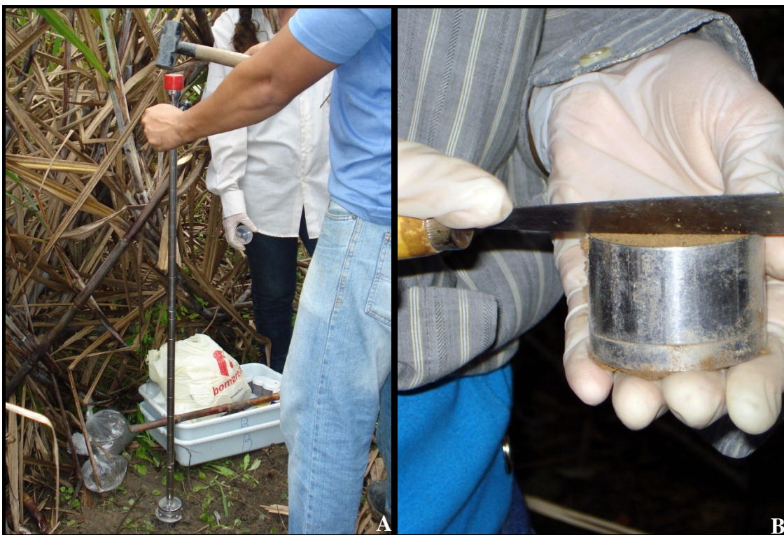
Anexo 6. Amostragem de solo com trado de amostra indeformada para análises físicas (A) e retirada da amostra de solo do anel cilíndrico (B).