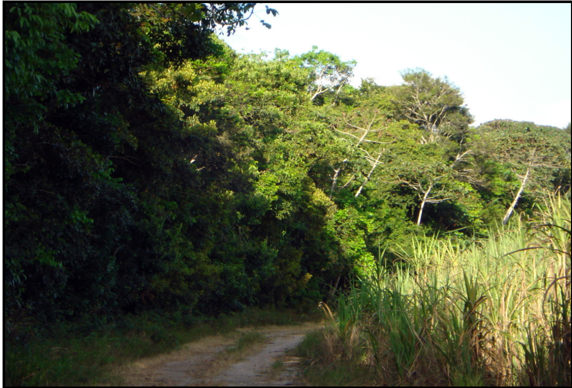
Anexo 3. Vista parcial do fragmento de Floresta Atlântica, na Usina Santa Teresa, Goiana, PE.