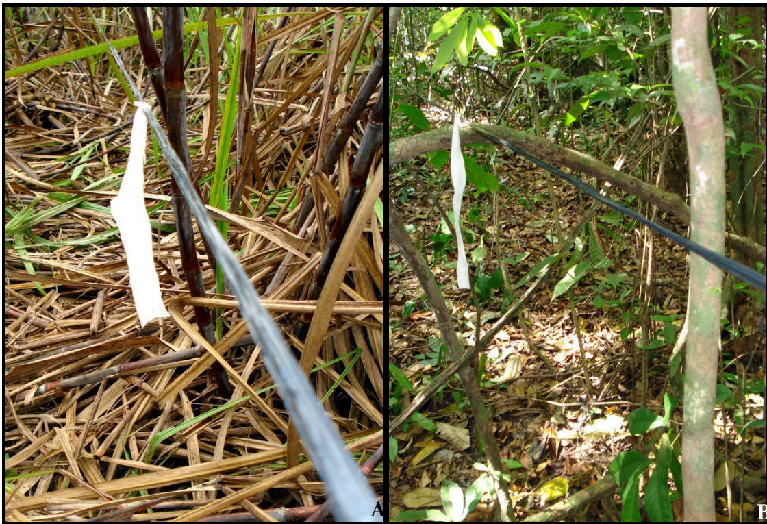
Anexo 4. Marcação dos transectos na área de cana (A) e de floresta (B), na Usina Santa Teresa, Goiana, PE.