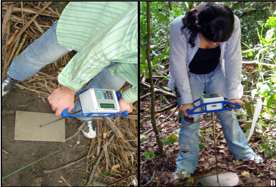
Anexo 5. Aferição da resistência mecânica do solo à penetração com penetrógrafo digital em área de cana (A) e floresta (B).