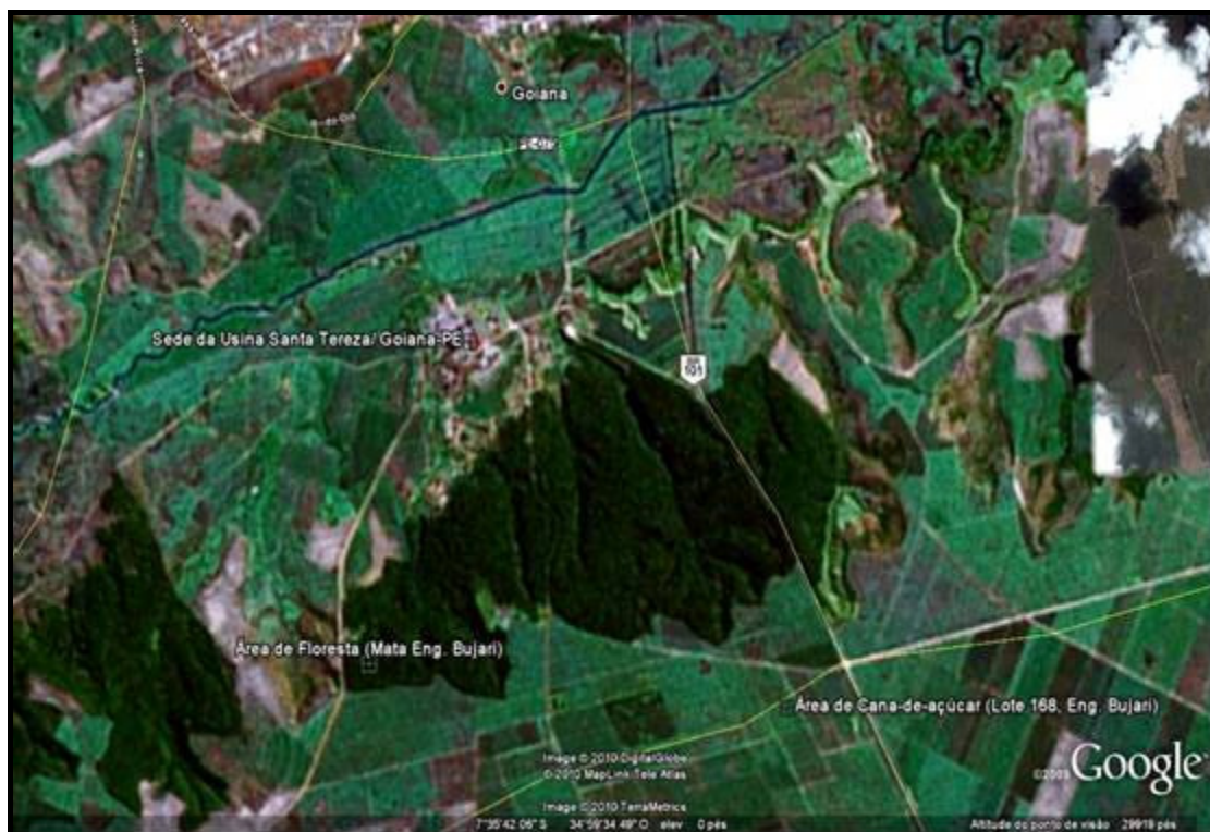
Anexo 1. Vista aérea da Usina Santa Teresa, Goiana, PE.