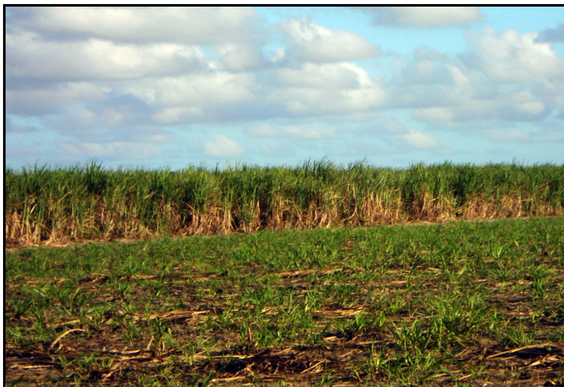
Anexo 2. Vista parcial da área de cultivo de cana de açúcar, lote 168, Engenho Bujari, Usina Santa Teresa, Goiana, PE.