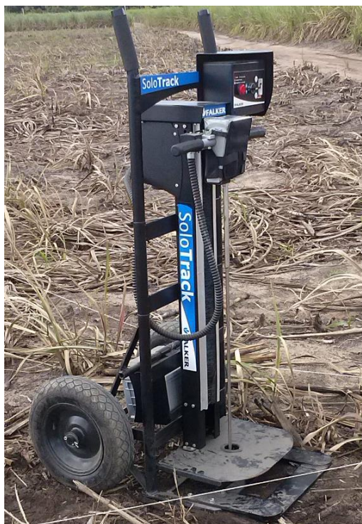
Figura 2: Penetrômetro digital.