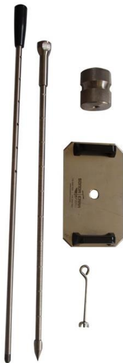
Figura 1: Penetrômetro de impacto.